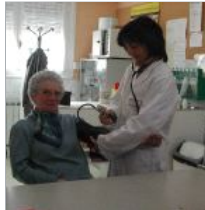
Una enfermera toma la tensión a una paciente.

Osakidetza reconoce la existencia del problema en esa zona de la provincia,